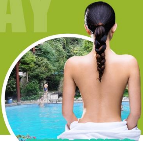
海螺沟天然温泉 泉暖心热，洗去行程的疲劳