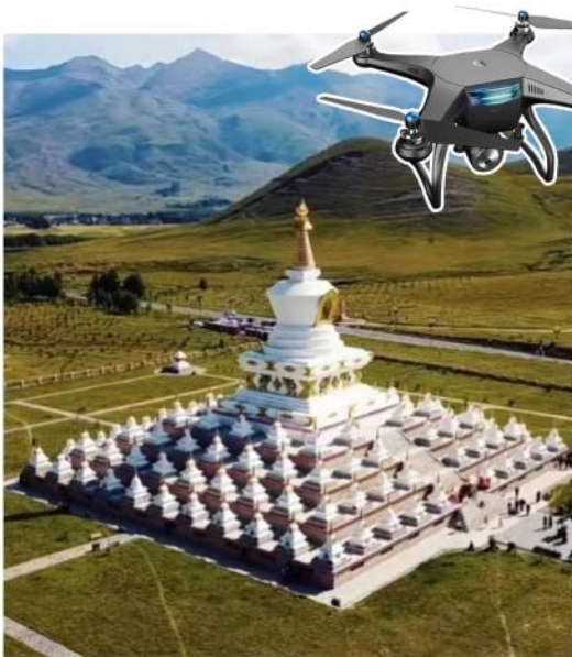
驻地摄影师无人机航拍 15秒团队小视频